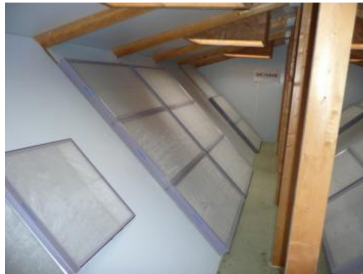
Filtre anti-viral et anti-microbien