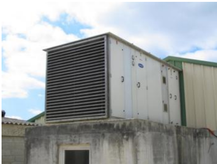
Filtration + surpression